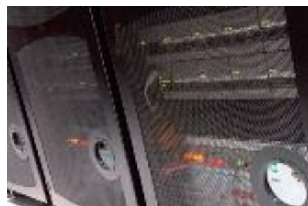
在爱丁堡大学的 HECToR XT4 机器